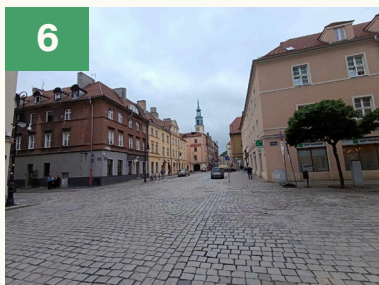
Tu ul. Ślusarska przechodzi w Szewską.