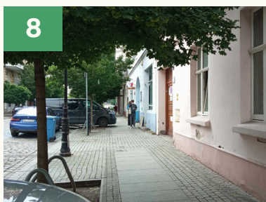
Dochodzimy do błękitnej bramy