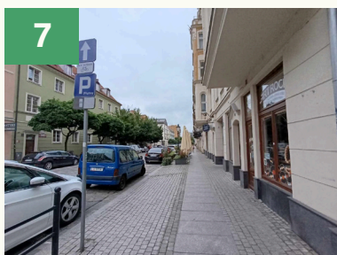
Szewską idziemy prosto.